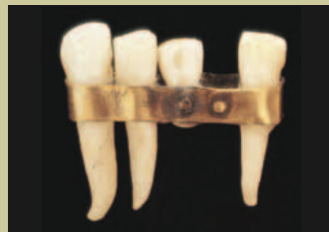
Dentier étrusque, env. 400 ans avant J.-C.

Ce n'est qu'en 1939 que Strock a jeté les bases de l'implantologie dentaire moderne à l'Université d'Harvard. Il a modifié la conception des implants, leur conférant une forme de filetage très proche de la vis à bois et utilisant un alliage à base de chrome-cobalt-molybdène.