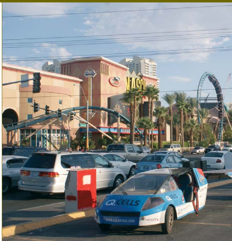
Taxi solaire à Las Vegas

quis par mon idée et se sont rapidement montrés prêts à apporter leur contribution. Je voulais absolument une voiture entièrement suisse. Mais comme l'industrie solaire n'en était encore qu'à ses débuts dans ce pays, j'ai dû rechercher mon sponsor principal à l'étranger. Il s'agit de la société allemande Q-Cells, le plus grand fabricant mondial de cellules solaires.