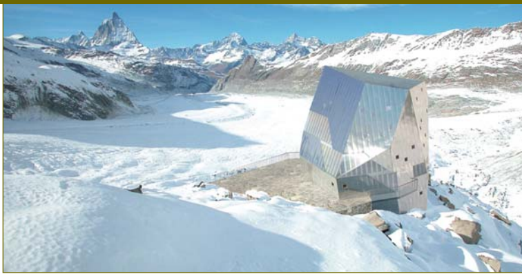
Visualisation digitale de la nouvelle cabane qui pourra héberger 120 personnes, un projet commun de l'ETH et du Club Alpin Suisse (CAS) dès l'automne 2009

des petites distances. Plus nous testerons d'énergies alternatives et plus nous constaterons qu'il est difficile de faire mieux que les solutions actuelles. Nos efforts doivent donc être particulièrement concentrés sur l'augmentation de l'efficacité des solutions traditionnelles ou sur leur utilisation plus économique.