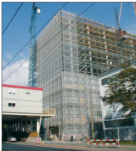
Le nouveau centre de production biotechnologique en construction

systématique et de travailler dans le respect de l'économie. Dans le cadre de la collaboration avec les commanditaires internes, de petites divergences d'opinion peuvent parfois surgir, qui sont alors discutées compte tenu du mandat et du projet.