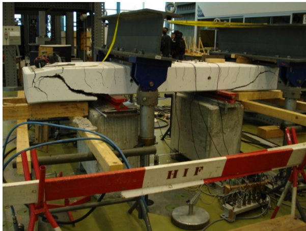
Anhand dieses Versuchskörpers wurden die Kräfteverschiebungen auf der Oberfläche gemessen.

Der Bauingenieur arbeitet in den Bereichen Risiko und Sicherheit, Holz und Stahl, Betontragwerke und Baudynamik, Tragverhalten von Stahlbeton bezüglich Erdbeben. Auf unserem Rundgang durch die Bauhalle haben wir verschiedene Forschungsobjekte kennengelernt, mit welchen experimentell die Stabilität und Sicherheit von Stahlbeton geprüft werden können.