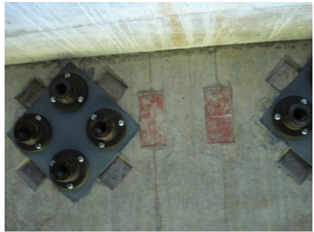
Unterseite der speziellen Bodenkonstruktion

Der Umweltingenieur befasst sich mit der Bodenreinigung, Wasserversorgung, Wasserreinigung und Hygieneproblemen in Entwicklungsländern.